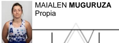
MAIALEN MUGURUZA Propia