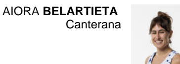
AIORA BELARTIETA Canterana